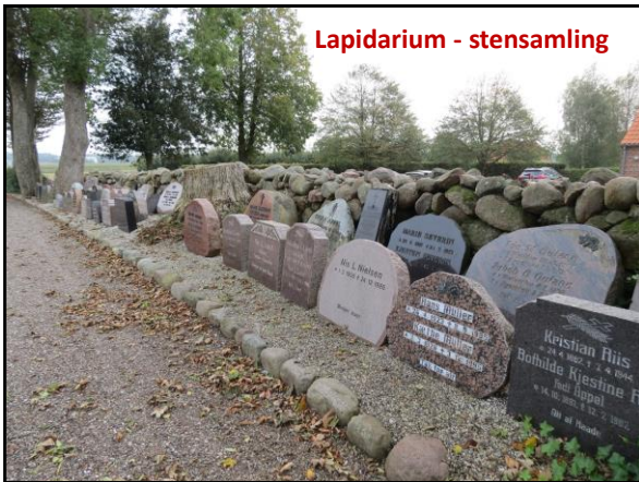
Lapidarium - stensamling