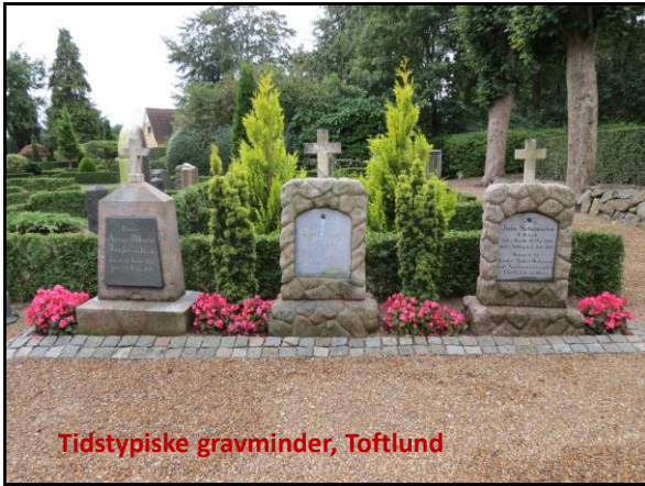
Tidstypiske gravminder, Toftlund